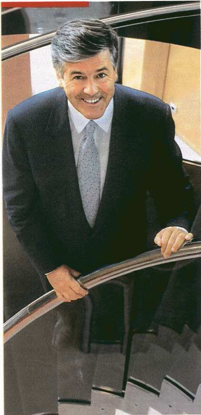
Josef Ackermann, Deutsche-Bank-Chef: